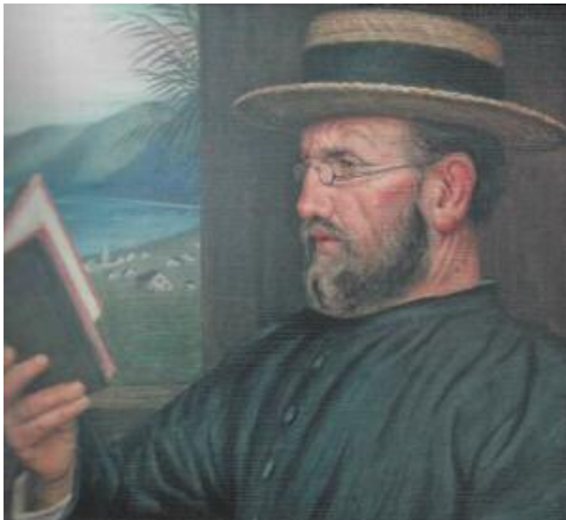
JOZEF DAMIAAN DE VEUSTER

відправився 10 травня, 1873 р. за власним бажанням на Молокаї (Molokai). Контрактуючи "проказу" безпосередньо, він помер 15 квітня, 1889 р., обслужуючи і сповідуючи віру Христову шістнадцять років серед "Прокажених". Про цю людину не тільки потрібно писати, але і знімати фільми, показуючи всьому Світу, а особисто для де яких керівників у Східній Європі, кому людство повинно бути вдячно своїм існуванням. Поки у нашому світі знаходяться особистості, які здатні на таке служіння – доти існує цей Світ і ми всі маємо майбутнє.