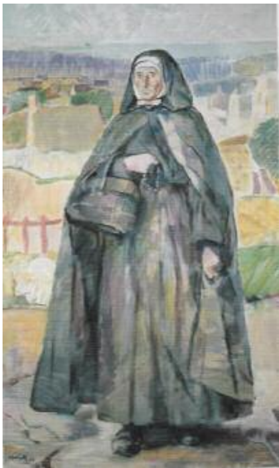
MARIE DE LA CROIX (JEANNE) JUGAN (1792-1879)

побачити вас!" У той час Паства, яку започаткувала Джоанна налічувала 2,400 Маленьких Сестер в 177 Будинках на 3 континентах (!!!).