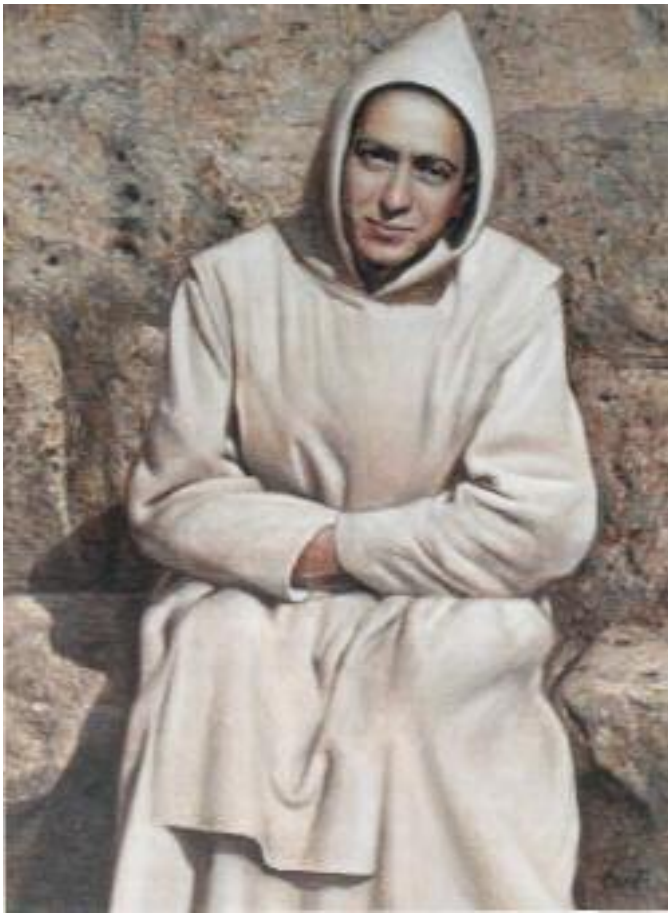
RAFAEL ARNAIZ BARON