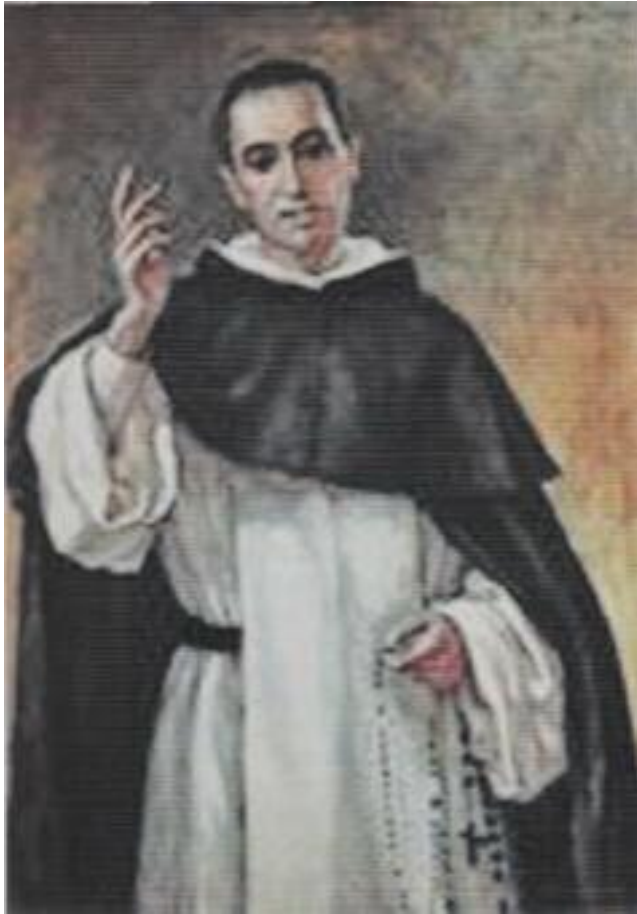
FRANCISCO COLL Y GUITART